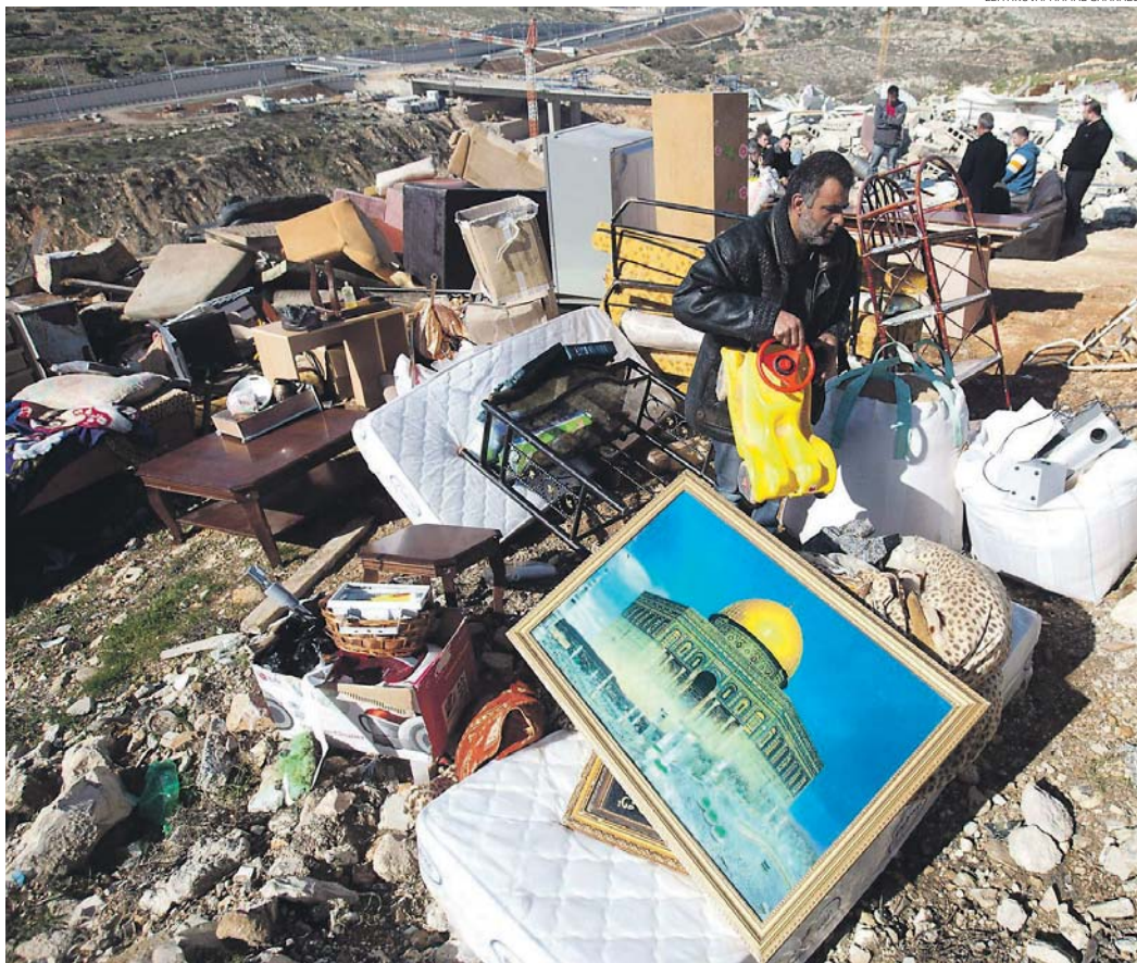
Palestiinalaismiestä pelasti toissa viikolla tavaroita Israelin puskutraktoreiden tuhoamasta talostaan Itä-Jerusalemien Beit Haninassa